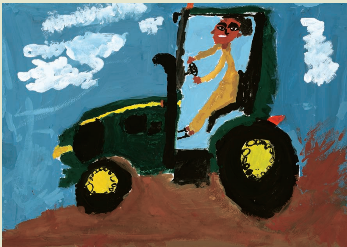
第35回肢体不自由児・者の美術展入賞作品「トラクターにのるお父さん」 稲森 歩夢 (9歳)