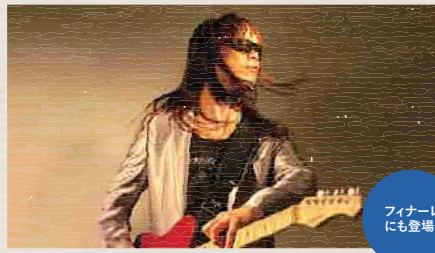
フィナーレ にも登場!

日本の他、中国、香港、台湾、フランス、韓国、イタリア、ニュージーランド、オーストラリア、インドネシア、タイ等世界各国で公演を行っているパントマイムコメディデュオ。2021年7月23日、2020年東京オリンピックの開会式で、ピクトグラムパフォーマンスの「中の人」として世界中から注目された。