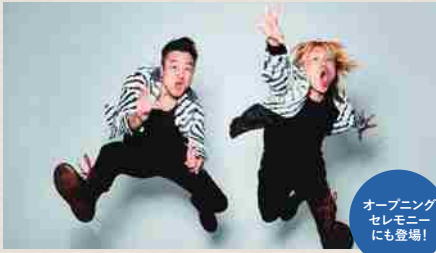
オープニング セレモニー にも登場!