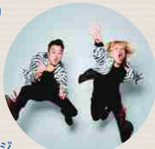
バンドマイム GABEZ 13:30/16:00