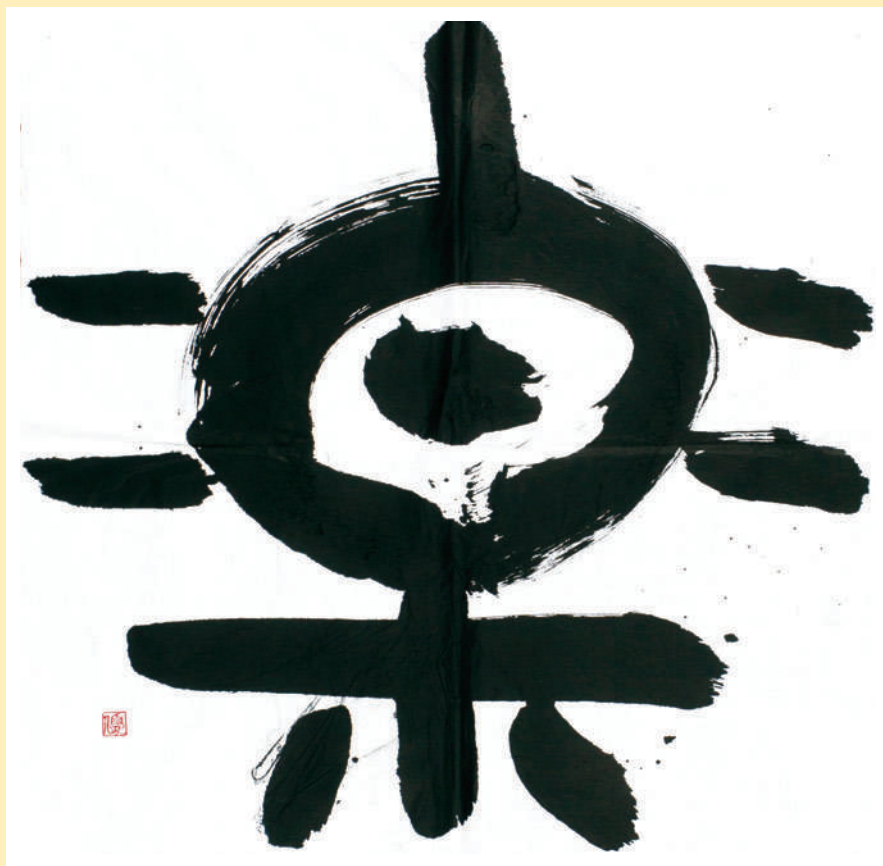
第34回肢体不自由児・者の美術展入賞作品「楽」