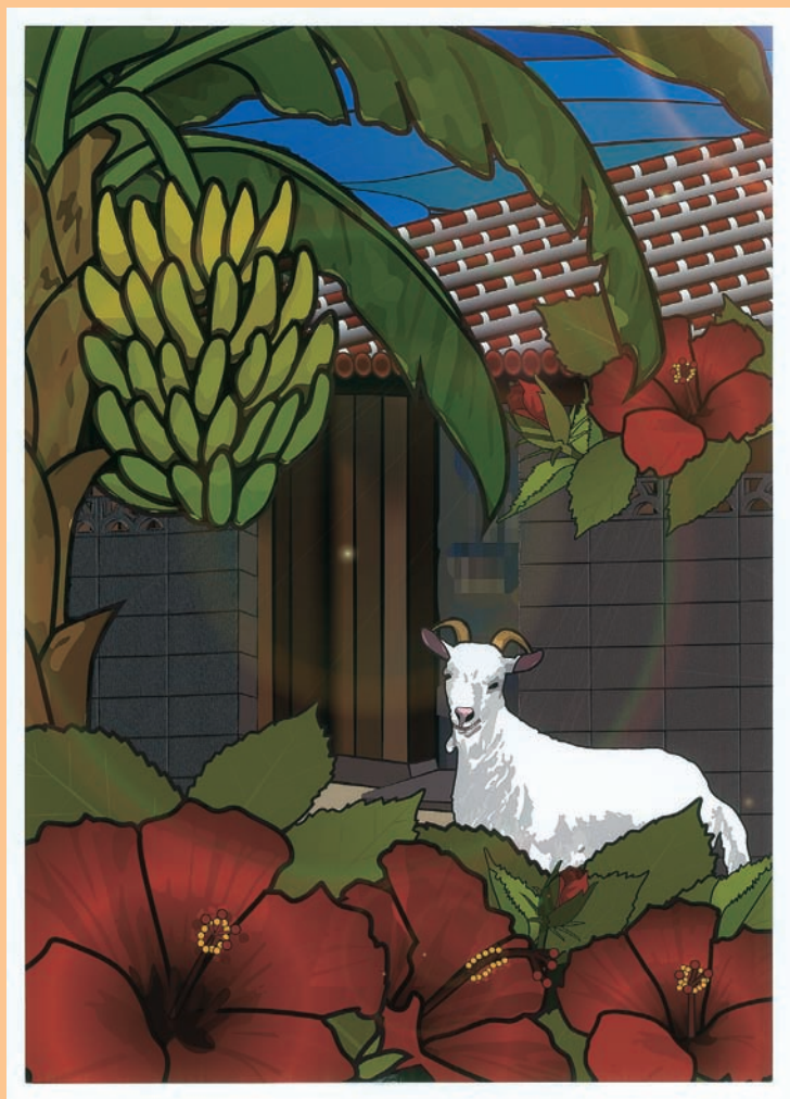
第35回肢体不自由児・者の美術展入賞作品「僕の友達」