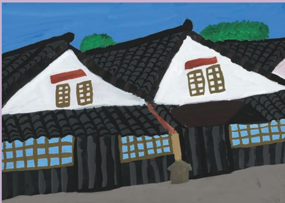
第35回肢体不自由児・者の美術展入賞作品「古くから使われている山居倉庫」